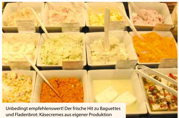
Unbedingt empfehlenswert! Der frische Hit zu Baguettes und Fladenbrot: Käsecremes aus eigener Produktion