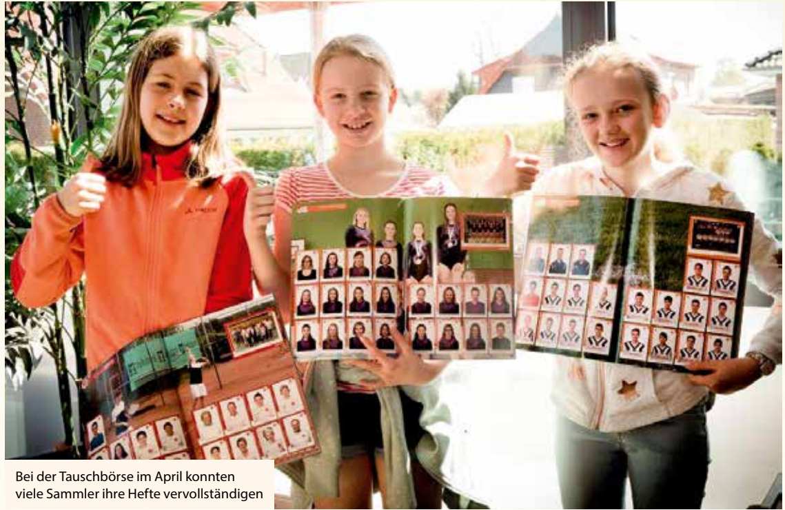
Bei der Tauschbörse im April konnten viele Sammler ihre Hefte vervollständigen

„Man fragte mich, ob schon wieder Weihnachten sei, weil draußen kein Parkplatz frei