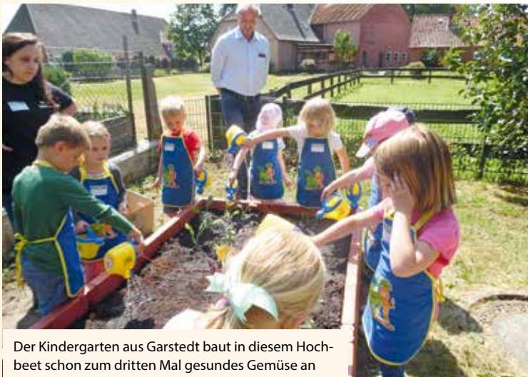
Der Kindergarten aus Garstedt baut in diesem Hochbeet schon zum dritten Mal gesundes Gemüse an