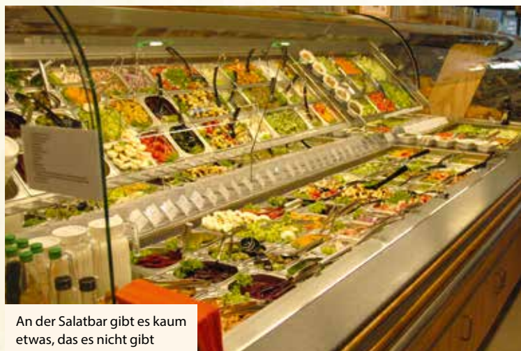
An der Salatbar gibt es kaum etwas, das es nicht gibt

Frikadellen, Backpflaumen im Speckmantel – die oft vergriffen sind, weil wir mit der Zuberei-