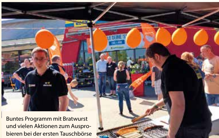
Buntes Programm mit Bratwurst und vielen Aktionen zum Ausprobieren bei der ersten Tauschbörse

Bei so viel Sammelleidenschaft war bald abzusehen, dass die ursprünglich gedruckte Menge von 56 000 Stickern nicht reichen würde. Schon nach sechs Wochen mussten 16 000 Klebebilder nachbestellt