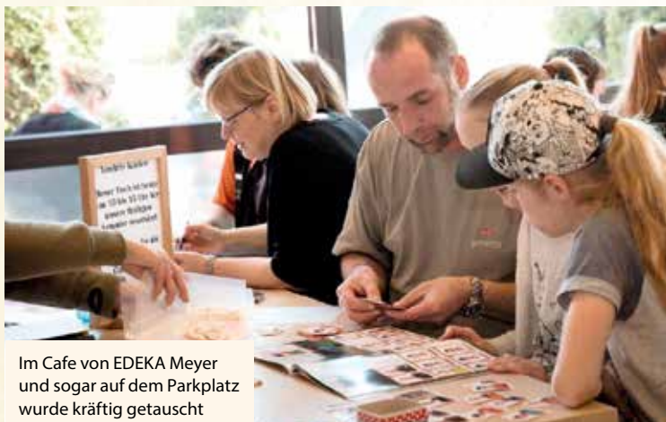
Im Café von EDEKA Meyer und sogar auf dem Parkplatz wurde kräftig getauscht